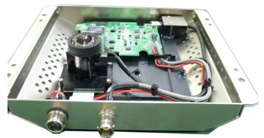
ボードカメラタイプ内蔵モデル