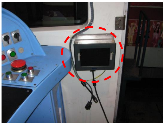
運転席と車掌室のモニター