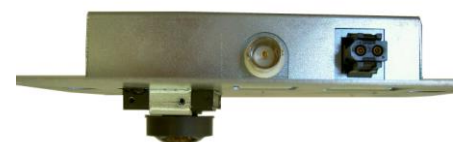
キューブタイプ内蔵モデル